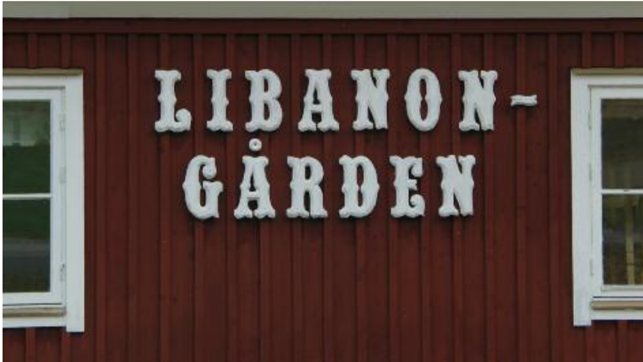
I år firar vi jul tillsammans på Libanongården.